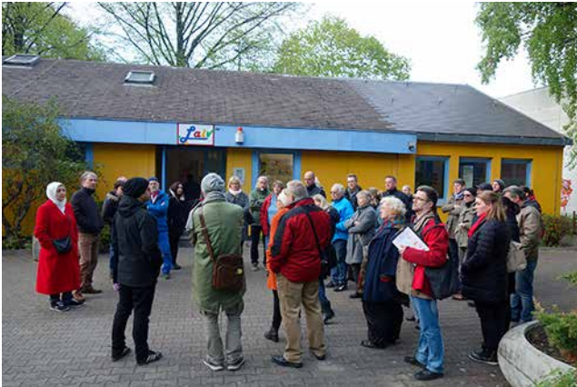
Die Quartiersratsmitglieder vorm Jugendzentrum Laiv

Nachdem der Quartiersrat in seiner März Sitzung über die soziokulturellen Projekte abgestimmt hatte, die ab diesem Sommer starten, stand die fünfte Arbeitssitzung im Zeichen möglicher Bauprojekte. Diese sollen in den folgenden Jahren im Quartier rund um die Auguste-Viktoria-Allee umgesetzt werden. In Vorgesprächen mit Ämtern, Einrichtungen, Sozialarbeitern, Gemeinden, Wohnungsbaugesellschaften und nicht zuletzt den Anwohnerinnen und Anwohnern des AVA-Kiezes wurden vier Orte ermittelt, die großen Bedarf für eine Qualifizierung, Weiterentwicklung und Verbesserung aufweisen: Die „Klix-Arena“ und der Platz vor der Albert-Schweitzer-Kirche in der Quäkersiedlung sowie der Rosengarten und das Areal rund um das Jugendcafé Laiv in der Auguste-Viktoria-Allee. Alle vier Projekte dienen der nachhaltigen Stabilisierung der Nachbarschaft sowie der sozialen Infrastruktur und sie schaffen neben Räumen, die im Stadtteil dringend gebraucht werden, generationenübergreifende Begegnungsorte für alle Menschen im Kiez. Dem Quartiersrat fiel die Aufgabe zu zwei mögliche Projekte zu priorisieren, die für eine Beantragung in Frage kommen. Denn die Fördermittel für die Baumaßnahmen stehen, anders als den soziokulturellen Projekten, nicht automatisch zu, sie müssen zusätzlich beantragt werden. Am Dienstag, den 25. April trafen sich die Quartiersräte um 18 Uhr am Quartiersbüro und nahmen im Rahmen