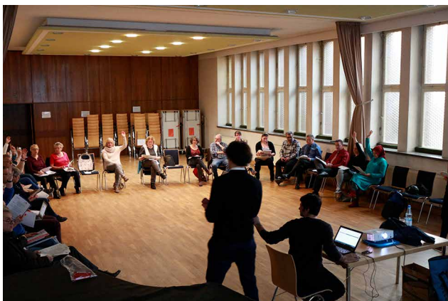
Der Quartiersrat auf seiner Sitzung im März 2017

Aus dem sogenannten „Projektfonds“ des Quartiersmanagements werden in der Regel Projekte mit mehrjähriger Laufzeit ab 5.000 Euro gefördert. Ziel des Fonds ist die Umsetzung von nachhaltig wirkenden, strukturfördernden Maßnahmen zur Erreichung der Handlungsziele (z.B. Verbesserung des Wohnumfeldes). Welche Projekte auf den Weg gebracht werden, darüber entscheidet der Quartiersrat, der aus Anwohner*innen und Akteuren besteht. Auf seinen letzten beiden Sitzungen hat unser Quartiersrat fünf neue Projekte bewilligt, für die das Quartiersmanagement nun geeignete Träger sucht, die die Projekte umsetzen. Bewerbungsschluss für alle Projekte ist Montag, 22.05.2017. Die Bewerbungen können beim Quartiersmanagement Auguste-Viktoria-Allee per E-Mail unter team@qm-auguste-viktoria-allee.de eingereicht werden. Für Rückfragen steht Ihnen das Quartiersmanagement-Team unter der Telefonnummer (030) 670 64 999 gerne zur Verfügung.