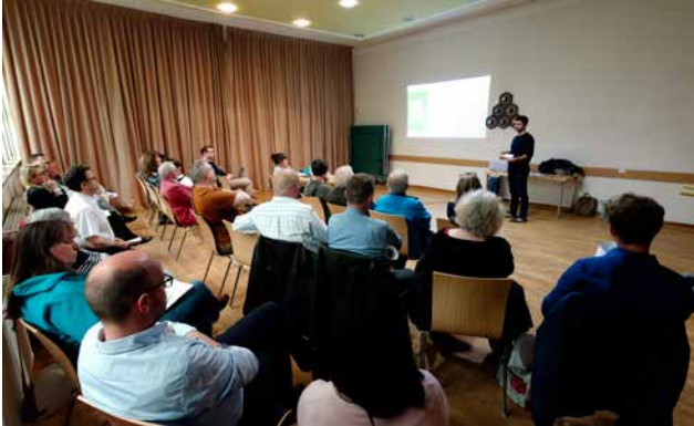
Der Quartiersrat diskutiert über das IHEK

Am Dienstag, den 16. Mai 2017 fand die sechste Sitzung des Quartiersrates zum Thema „Integriertes Handlungs- und Entwicklungskonzept“ (IHEK) statt.