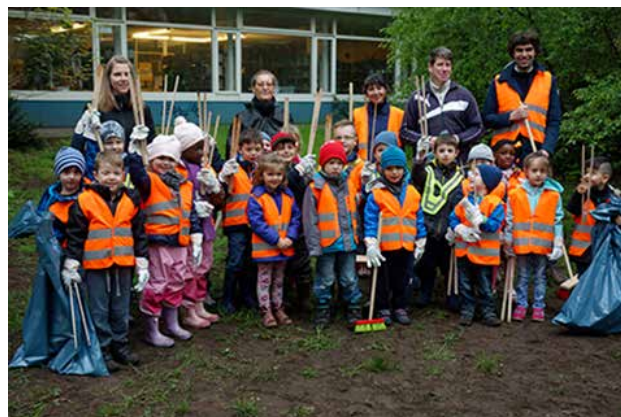
Die engagierte Putztruppe vor der Stadtteilbibliothek

Am Freitag, den 5. Mai 2017 fanden im Rahmen von „Berlin Machen“ zwei Kiezputzaktionen statt. Um 10 Uhr trafen sich Kinder der Humanistischen Kita und der Kita St. Rita auf der Grünfläche vor der Stadtteilbibliothek und machten sich daran, die Wiese sowie die Gebüschse von Unrat freizumachen. Die Kinder waren sehr engagiert und voller Tatendrang und das Ergebnis konnte sich durchaus sehen lassen.