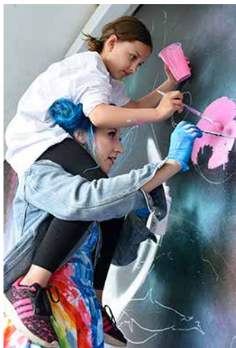
... und Praxis

URBAN NATION, der Mieterbeirat Quäkerstraße und die Gewobag haben in einer Gemeinschaftsaktion am 14. Mai 2017 zu einem kreativen Kids-Workshop in der Quäkerstraße eingeladen: 13 Kinder aus der Reinickendorfer Nachbarschaft schauten vorbei