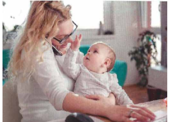
Der Bezirk unterstützt Alleinerziehende mit einem umfangreichen Beratungsangebot.

Berlin ist nicht nur eine wachsende Stadt, sondern auch gleichzeitig die Stadt der Alleinerziehenden in Deutschland, dieses trifft auch für den Bezirk Reinickendorf zu.