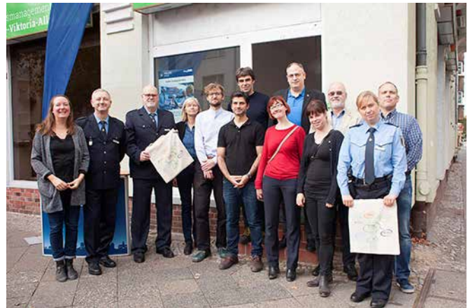
Das Netzwerk „Sicher rund um die Auguste“ hat vor allem die Sicherheit älterer Menschen im Blick.