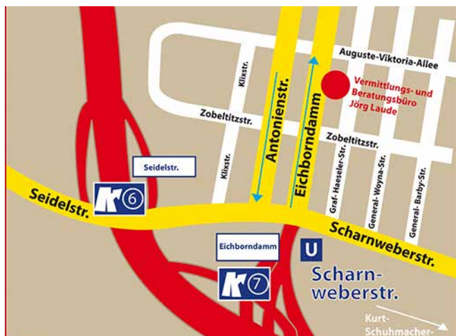
Das Büro befindet sich gut erreichbar am Eichborndamm 28.

Als Versicherungsmakler stehen ihnen und somit auch ihren Kunden nun mehr Optionen, gegenüber ihrer früheren Tätigkeit, offen. Beide Firmen arbeiten grundsätzlich frei von allen Versicherungsgesellschaften und Banken und sind somit in der Lage für jeden einzelnen Kunden ganz auf die individuellen Bedürfnisse zugeschnittene Produkte von über 200 Versicherungsgesellschaften und verschiedenen bundesweiten Banken zu äußerst guten Konditionen zusammenzustellen. Produkte von verschiedenen