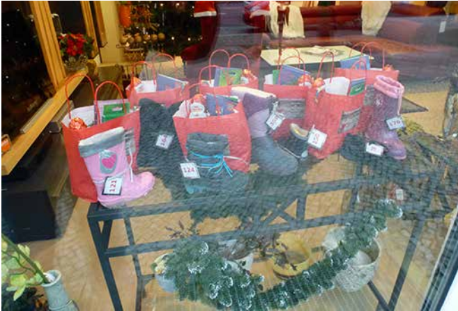
Geschenk-Pakete letztes Jahr im Schaufenster der Firma Möbel-Domeyer in der Scharnweberstraße.

Die Gewerbetreibenden im Quartiersmanagementgebiet Auguste-Viktoria-Allee führen auch dieses Jahr wieder die gemeinsame Nikolaus-Aktion „Stiefel raus für den Nikolaus“ durch, die sich an die Kinder und Familien im Gebiet richtet. Das Gewerbenetzwerk „Wir für Euch“, welches sich aus dem Gewerbenetzwerk-Projekt des Quartiersmanagements gegründet hat, lädt zurzeit wieder alle Dienstleister, Gastronomen, Einzelhändler und Handwerker im Kiez ein, sich bei der Aktion zu beteiligen. Letztes Jahr wurde die Aktion von 19 teilnehmenden Gewerbetreibenden konzipiert und erstmalig durchgeführt. Bei der Aktion befüllen die Gewerbetreibenden auch dieses Mal wieder die Nikolausstiefel der Kinder im Kiez und stellen sie in ihre Schaufenster. 2017 wurden rund 200 Stiefel befüllt, die Maßnahme wird durch die Gewerbetreibenden finanziert.