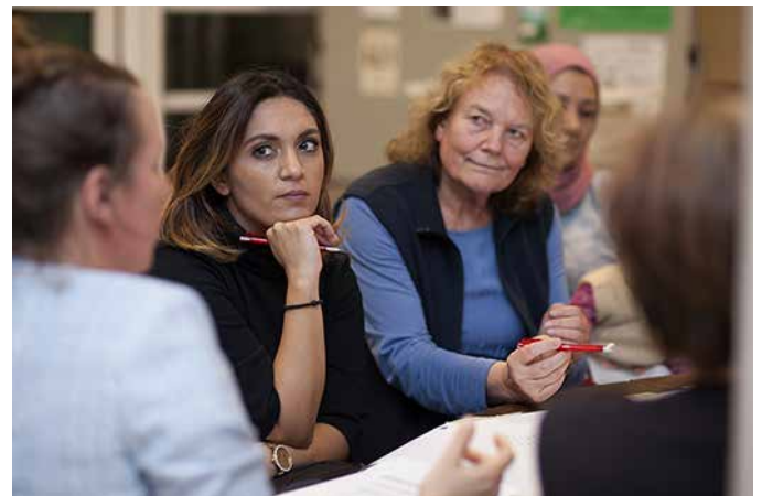
Gespannte und konstruktive Arbeitsatmosphäre auf dem ersten Treffen des neuen Quartiersrates.

Bei der ersten Sitzung des neugewählten Quartiersrates am 16.10.2018 ging es direkt hoch her: ca 35 Mitglieder des Quartiersrates versammelten sich in den Räumen der Gemeinde St. Rita um gemeinsam zu besprechen, welche Schwerpunkte sie für die Arbeit des Quartiersmanagements in den nächsten zwei Jahren setzen wollen.