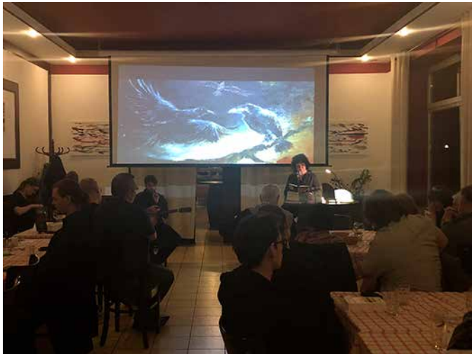
Mystisches und Mysteröses gab es bei der „Rabenschwarzen Lesung“ in der Fleischerei Rabe.