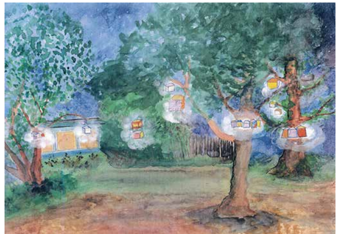
Die Lichtergalerie wärmt mit selbst bemalten Lampenschirmen die kalte Jahreszeit im Kiez auf.

Der Lampionumzug endet deshalb im Nachbarschafts- und Lesegarten, wo die Kinder und weitere Teilnehmerinnen und Teilnehmer zusammenkommen werden um den Abend bei Kinderpunsch und Butterbrot sowie Musik und einer Lesung ausklingen zu lassen.