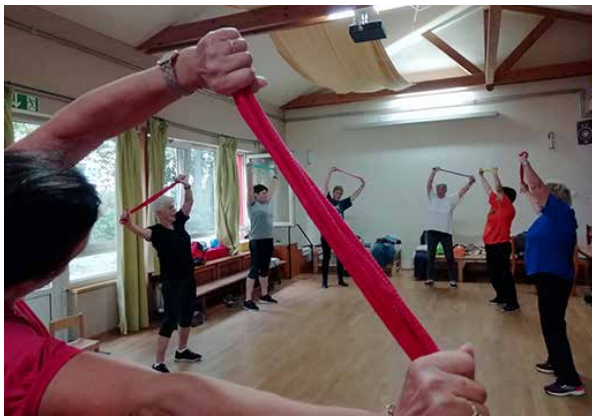
Tut gut: Entspannung für pflegende Angehörige.

Gruppe trifft sich jeden 2. & 4. Dienstag im Monat, 17–18.30 Uhr im Mehrgenerationenhaus Albatros in der Auguste-Viktoria-Allee 17a. Die Teilnahme ist kostenlos.