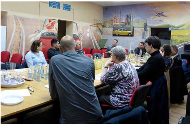
Die Gewerbetreibenden arbeiten gemeinsam an der Standortentwicklung im Kiez.

Am 25.10. fand das zweite Treffen des Gewerbenetzwerks im Quartiersmanagementgebiet Auguste-Viktoria-Allee statt. Die Fahrschule SEVIM stellte als teilnehmendes Unternehmen ihre Räumlichkeiten zur Verfügung und lud gemeinsam mit dem Quartiermanagement und dem Projektteam des Standortentwicklungsbüros LOKATION:S zum Austausch und zur Diskussion ein. Gewerbetreibende, Immobilieneigentümer und weitere Interessierte entwickelten eine kurzfristige Weihnachtsaktion, die sich an die Kinder und Familien im Kiez richten wird.