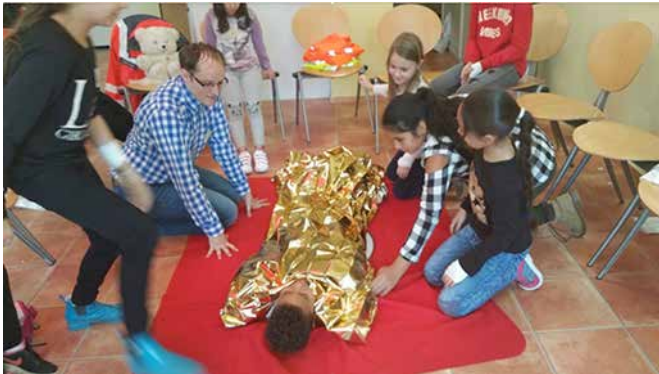
Übung mit der Wärme-Decke...

Dank des Aktionsfonds 2017 des Quartiersmanagements und der Aktionsfondsjury konnte das Projekt „Helfen ist kinderleicht“ in den Herbstferien für Kinder und Jugendliche kostenlos starten.