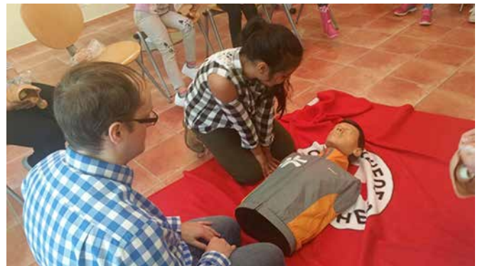
...und mit der Reanimationspuppe.

Das Projekt wird durch vier Ehrenamtliche und eine Mitarbeiterin des DRK Kreisverbandes Reinickendorf-Wittenau e.V. durchgeführt.