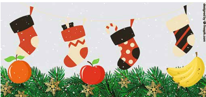
Die Gewerbetreibenden werden zum Nikolaustag die Schuhe von Kindern aus dem Kiez weihnachtlich befüllen.

Am 25.10. fand das zweite Treffen des Gewerbenetzwerks im Quartiersmanagementgebiet Auguste-Viktoria-Allee statt. Die Fahrschule SEVIM stellte als teilnehmendes Unternehmen ihre Räumlichkeiten zur Verfügung und lud gemeinsam mit dem Quartiermanagement und dem Projektteam des Standortentwicklungsbüros LOKATION:S zum Austausch und zur Diskussion ein. Gewerbetreibende, Immobilieneigentümer und weitere Interessierte entwickelten eine kurzfristige Weihnachtsaktion, die sich an die Kinder und Familien im Kiez richten wird.