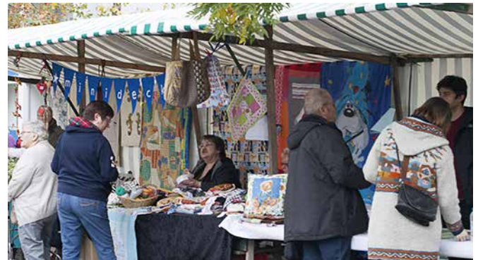
Die „Minideckis“ verkauften selbst Genähtes.

Das Team vom Quartiersmanagement war natürlich auch vor Ort. Besonders beliebt bei Kindern und Jugendlichen waren unsere Giveaways wie