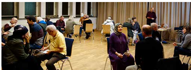
Welche Projekte braucht der Kiez? Ideen-Workshop im Gemeindesaal der St. Rita.

Das Team des Quartiersmanagement begrüßte am 10. Oktober die Quartiersräte zur 9. Sitzung. Im Gemeindesaal der St. Rita, der sich inzwischen zu einem beliebten Veranstaltungsort im Kiez entwickelt hat, fand der diesjährige Ideen-Workshop für die kommenden Projekte statt.