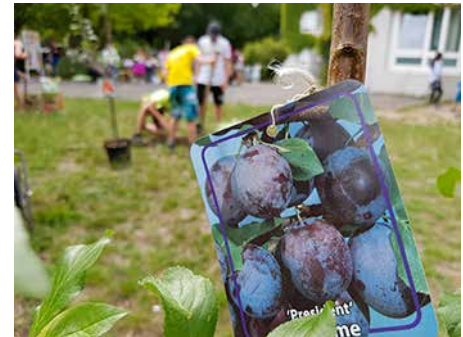
... wurden vier Obstbäume gepflanzt.

Durch Unterstützung des bezirklichen Straßen- und Grünflächenamtes und des Schulamtes konnte die Vision dann schnell in die Tat umgesetzt werden. Dafür standen Fördermittel aus dem Programm „Sozi-