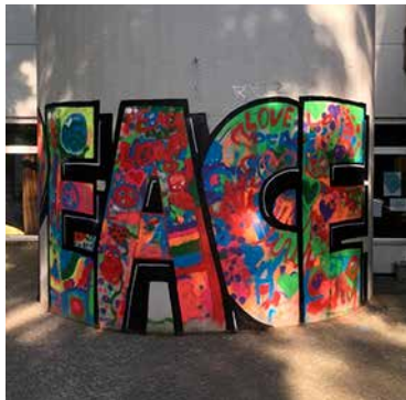
Bunt statt grau: das Ergebnis des Graffiti-Workshops.

geeigneten Räumlichkeiten für ca. 20-30 Kids, die am besten abgedunkelt werden können. Wir freuen uns über Ideen!