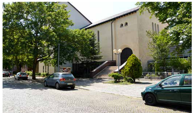
Die Pfarrei St. Rita in der General-Woyna-Straße.

ziales Verhalten auffielen, durch Training, Gespräch, Gemeinschaftserfahrungen und Spiritualität ihre eigentliche Rolle und ihren Platz in der Gesellschaft (wieder-) finden.