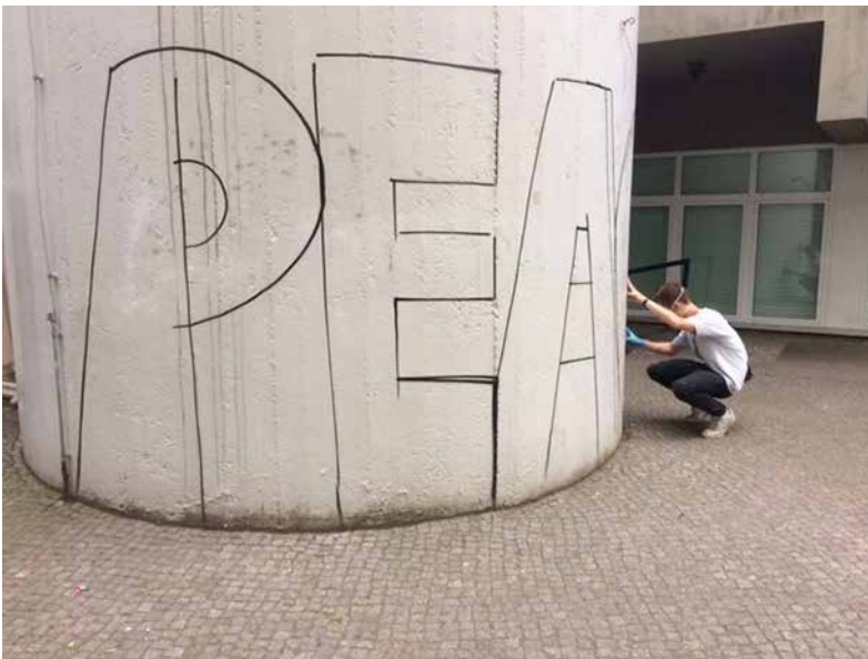
Graffiti-Workshop vor der Segenskirche.

Der Verein kein Abseits e.V. ist seit 2012 aus dem Auguste-Viktoria-Kiez nicht mehr wegzudenken. Im Rahmen des vom Quartiersmanagement finanzierten Projektes „Freizeit und Bewegungsangebote“ sind die Expert/-innen im Bereich Jugendbeteiligung und Freizeitangebote in den zurückliegenden Monaten auf vielen Ebenen aktiv geworden und haben einiges auf die Beine gestellt. Im Frühjahr wurden mit den Schüler/-innen der Reineke-Fuchs-Grundschule zunächst Ideen und Wünsche für neue Angebote entwickelt. Über den Stand der Top Five Freizeit-Angebote wollen wir im Folgenden informieren: