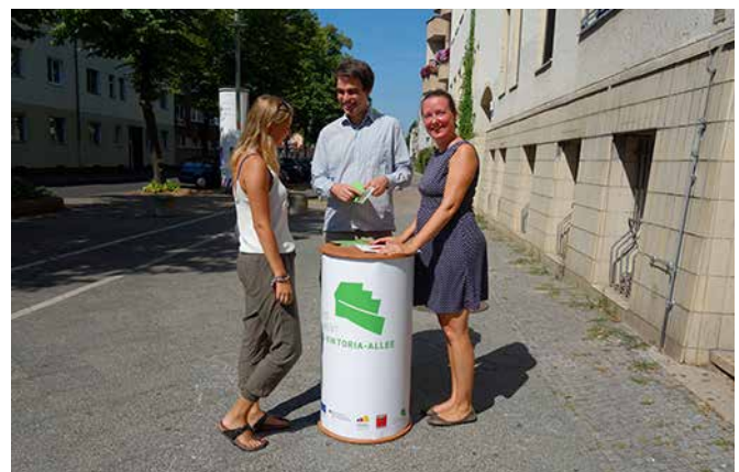
Welche Themen bewegen die Anwohner/-innen? Das QM-Team fragt auf der Straße nach.

Quartiersrat, der darüber mitentscheidet, welche Themen bearbeitet und welche Projekte umgesetzt werden. Der Quartiersrat besteht zur Hälfte aus Vertreter/-innen der sozialen und Bildungseinrichtungen im Kiez und zur anderen Hälfte aus Menschen, die im Kiez wohnen – und diese Mitglieder werden am 18. September neu gewählt.