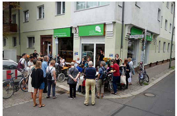
Großer Andrang vorm Quartiersbüro bei der Ausstellungseröffnung am 19.07.2018.