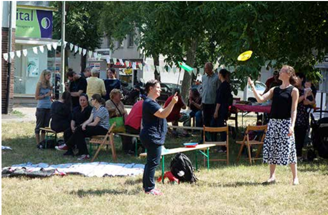
Ein schattiges Plätzchen und Spiele für die Großen.

„Freitag der 13. Und doch - um Punkt 12.30 hört der Regen auf. Gerade, als die Vorbereitungen ihren Lauf nehmen. Dann Sonne und Wind, kurz, das wundervollste Partywetter, das man sich wünschen kann. Ich persönlich hatte großes Vergnügen daran, den Teilnehmer/-innen, ob groß, ob klein, bei der Erfüllung der Aufgabe ‚Lies anderen etwas vor‘ behilflich zu sein. Insbesondere, da es reichlich Kaffee gab und das Kuchenbuffet mit leckeren Kuchenspenden bis zum Schluss prall gefüllt blieb. Endlich ergab sich auch wieder eine Gelegenheit, unsere Jonglierkünste an den Mann und an die Frau zu bringen und einen wirklich tollen Nachmittag mit lieben Freunden und Nachbarn zu verbringen.“