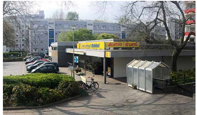
Alt-68er: Den Supermarkt in der Quäkerstraße gibt es seit 50 Jahren.