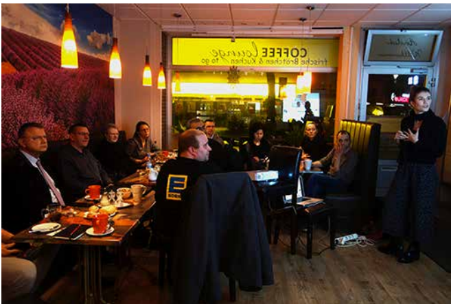
Treffen des Gewerbenetzwerks in Victoria's Café

Am 23.01.18 fand das dritte Treffen des Gewerbenetzwerks mit interessierten Händlern des Auguste-Viktoria-Kiezes statt. Auf der Tagesordnung stand die Entwicklung eines Maßnahmenplans für 2018. In Victoria's Café diskutierte das Netzwerk unterschiedliche Formate für eine gemeinsame Vermarktung des Standorts, die bereits bei der Auftaktveranstaltung im September als zentrale Maßnahme identifiziert wurden.