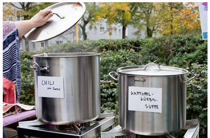
Essen verbindet: die Mobile Küche auf dem Herbstfest 2017.

Gutes Essen darf dabei natürlich nicht fehlen und so wurden vergangenes Jahr über den Aktionsfonds Gelder für eine mobile Küche beantragt. Beim Herbstfest, wo die mobile Küche prompt zum Einsatz kam, bewahrheitete sich das Sprichwort: Essen verbindet! Das Chili sin carne und die Kartoffel-Kürbissuppe waren schnell verputzt. Um als Nachbarschaftstreff mit integriertem Sprachcafé noch sichtbarer zu sein und die Treffen an sonni-