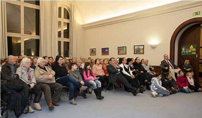
Bis auf den letzten Platz besetzt: die Aula der Mark-Twain-Grundschule.