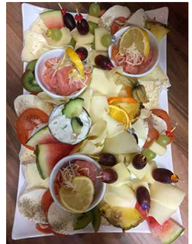
Frühstücksplatte in Victoria's Café