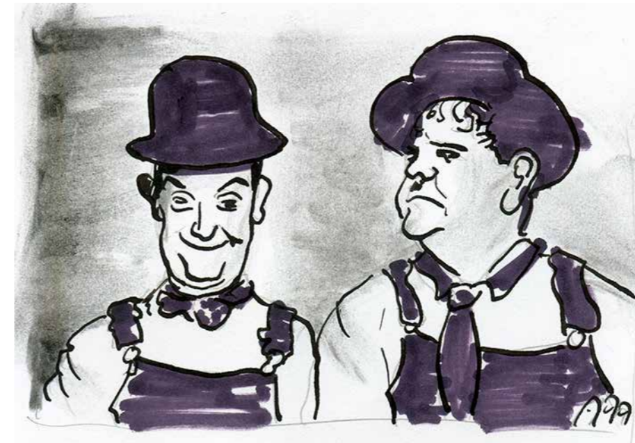
Vielleicht bald im Kiez: Filmklassiker wie die Komödien von Stan & Ollie

„Kino für Kids“ ist bereits ein relativ bekanntes Angebot der Stadtteilbibliothek, die unter den kleineren Bibliotheksnutzer/-innen sehr beliebt ist. Nun freuen wir uns, dass zwei Filmemacher aus dem Kiez dieses kulturelle Angebot auch für Erwachsene ermöglichen möchten. Hierfür haben sie in der Aktionsfondsjury einen Antrag eingereicht und diesen in der letzten Sitzung vorgestellt. Die Idee beinhaltet Filmklassiker zu zeigen, die Filmgeschichte geschrieben haben, die zum Nachdenken anregen oder einfach nur unterhalten. Die Jurymitglieder waren an der Idee sehr interessiert und haben dem Antrag zugestimmt. Nun gilt es für die Filmemacher geeignete Räume zu finden und wir hoffen ihnen bald einen Termin für die erste Vorführung mitteilen zu können.