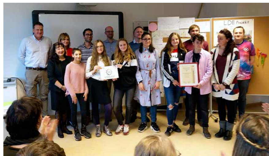
Preis für Soziales Lernen und Demokratiebildung für die Max-Beckmann Oberschule und die Beteiligungsfüchse.

Die Max-Beckmann Oberschule und Beteiligungsfüchse gemeinnützige GmbH erhalten für ihre Zusammenarbeit den Helga-Moericke Preis für soziales Lernen und die Förderung von Demokratiebildung!