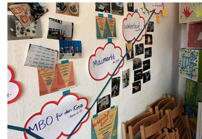
Ob Lichterlauf oder Maimarkt: Die Nachbarschaftsaktionen brachten Menschen zusammen

Den krönenden Abschluss stellten sicherlich der Lichterlauf und der Lichtermarkt zu St. Martin dar, an dem sich ca. 800 Menschen beteiligt haben, darunter 6 Kindertagesstätten, der Interkulturelle Mädchen- und Frauentreff, die Cooperative Mensch und der Familienpunkt. Einen bleibenden Eindruck hinterließen sicherlich die Leuchtskulpturen in Form von