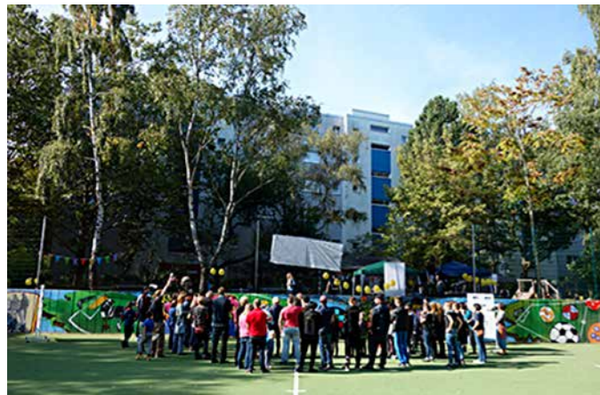
Wie die Klixarena einmal aussehen wird, wurde gemeinsam mit Anwohner/-innen und Nutzer/-innen diskutiert.

Es ist so weit: Die Planung für die Umgestaltung der Klixarena und verbindenden Wege ist fertig. In einer Bürgerversammlung am Mittwoch, 22.01.2020, um 17.30 Uhr werden die Pläne im Albert-Schweitzer-Haus (Auguste-Viktoria-Allee 51) vorgestellt. Alle interessierten Anwohnerinnen und Anwohner sind herzlich eingeladen.