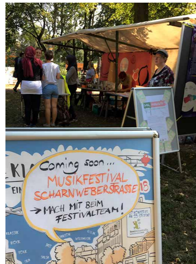
Wer mitmachen will, ist herzlich willkommen: Das Musikfestival im AVA-Kiez findet im Mai 2020 statt.

Allzu lang dauert es schon gar nicht mehr, bis der Lärm von Verkehr und Trubel an der Scharnweber Straße für einen Tag der Musik von den Klängen verschiedenster Instrumente und Stimmen harmonisiert wird. Denn das Musikfestival wird im Mai 2020 stattfinden und den Frühling angemessen im Auguste-Kiez begrüßen!