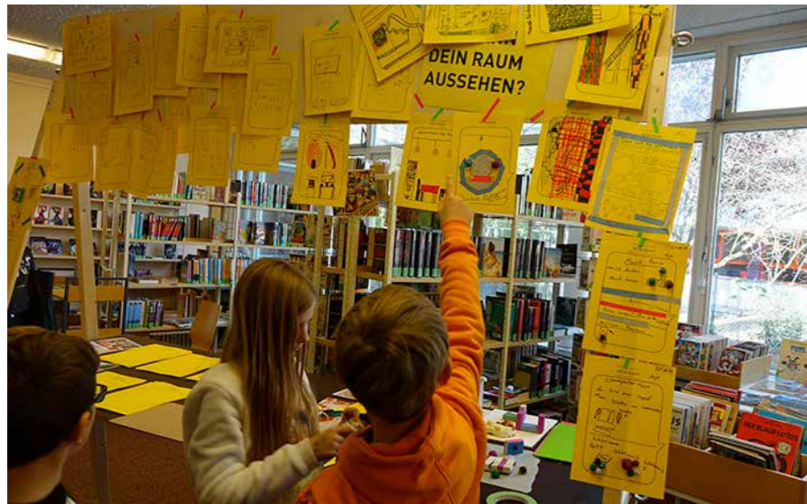
Nutzer/-innen diskutieren über die Umgestaltung der Stadtteilbibliothek.

Wie soll in Zukunft die Stadtteilbibliothek an der Auguste-Viktoria-Allee aussehen? Welche Angebote und Räumlichkeiten wünschen sich die Nutzerinnen und Nutzer? Mit verschiedenen Beteiligungsveranstaltungen wurden im letzten halben Jahr lokale Akteure, Einrichtungen und die Bewohnerschaft nach ihren Bedarfen für ein neu gedachtes Kultur- und Bildungszentrums befragt.