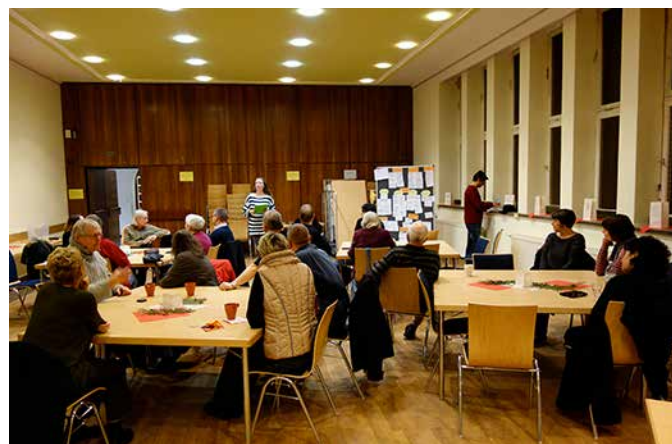
Der Quartiersrat diskutiert Bedarfe im Kiez...

Im Dezember fand sich der Quartiersrat zum letzten Mal in diesem Jahr im Gemeindesaal der St. Rita ein. Nachdem das Gremium im Oktober und November sich über neue Bedarfe für den Kiez ausgetauscht hatte, hatte es nun die Aufgabe zu den Schwerpunktthemen Ergänzungen zu machen und schließlich zu priorisieren.