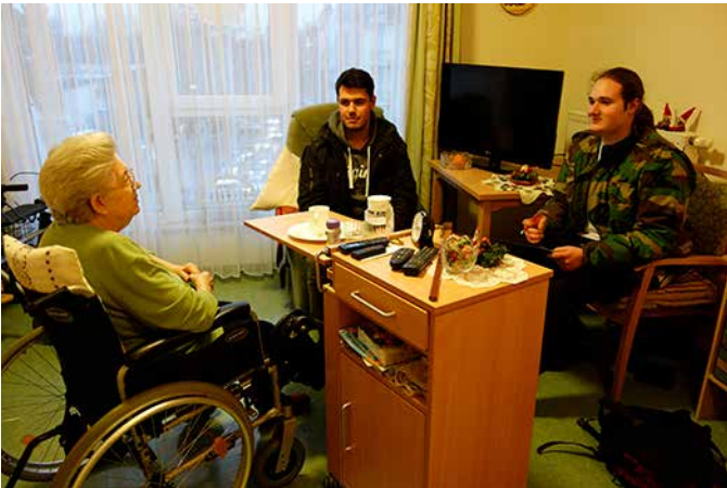
Schüler der Max-Beckmann-Oberschule diskutieren mit einer Bewohnerin aus dem AVA-Kiez.

Im Kiez rund um die Auguste-Viktoria-Allee finden in der Vorweihnachtszeit erstaunliche Begegnungen statt! Schülerinnen und Schüler der Max-Beckmann-Oberschule haben im Rahmen des Quartiersmanagement-Projekts „Philosophiemeile“ Fragen gesammelt und diskutieren mit älteren Menschen, mit Grundschüler/-innen und Nachbar/-innen grundlegende philosophische Dilemmata. Dabei geht es sowohl um Zwickmühlen im Alltag, als auch um die großen Dilemmata der Philosophie.