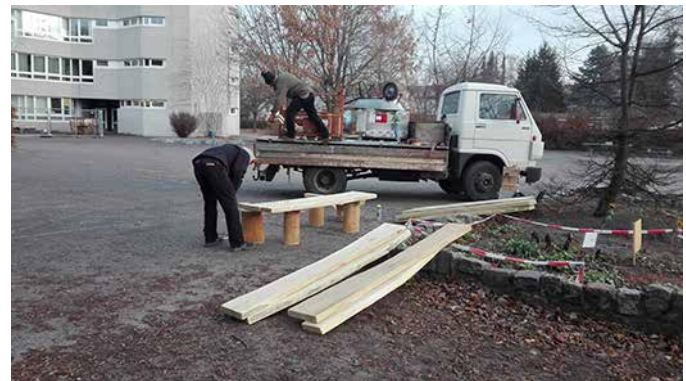
Anlieferung der Einzelteile...

Nun geht's auch auf dem Schulhof der Reineke-Fuchs-Grundschule los. Das Gartennetzwerk „Grüne Auguste“ plante hier gemeinsam mit der Schule neue Sitzgelegenheiten, kleine Spielgeräte und neue Pflanzen.