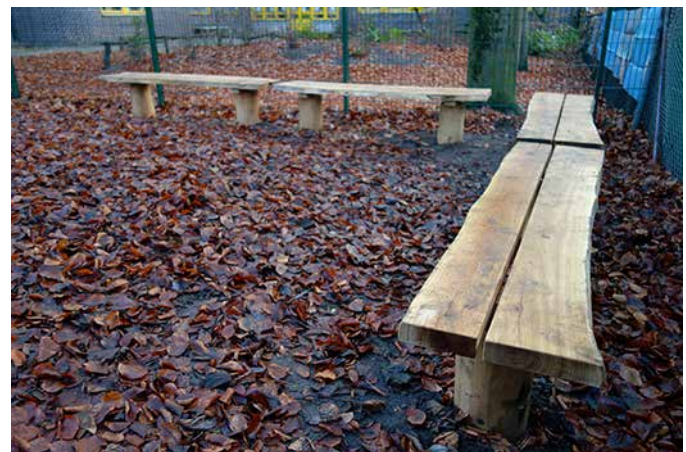
... und das Ergebnis.

Das Projekt „Grüne Auguste“ und somit auch die Verschönerung des Schulhofs werden aus Mitteln des Quartiersmanagements finanziert.