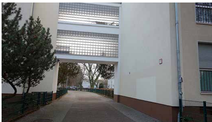
Die graffitilose Hauswand an der General-Woyna-Straße.

Wer den breiten Fußweg von der General-Woyna-Straße zur Humannstraße nutzt und beim Durchschreiten der Überbauung die tadellos renovierten Seitenwände sieht, denkt sich: „Na also - ,s geht doch!“ Hier wurden nämlich drei Dinge richtig gemacht, um das stille Heer der Sprayer zu entmutigen, für die sonst die frisch gemachten Wände zweifellos ein gefundenes Fressen gewesen wären: Es wurden eine Kamera und ein helles Licht mit Bewegungsmelder installiert, und es wird, drittens, jede Graffiti-Sünde offensichtlich sofort übermalt.