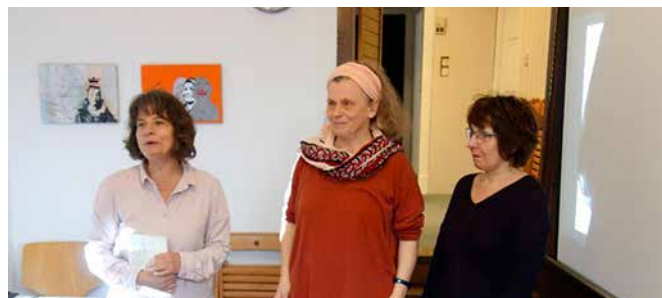
Ausstellungseröffnung im Quartiersbüro

KIEZKÖNIGINNEN ist die künstlerische Umsetzung des intergenerativen, transkulturellen Projekts „Hal-tung bewahren“, das der Verein dritter frühling e.V. unterstützt vom Fonds „Demokratie leben!“ initiiert hat.