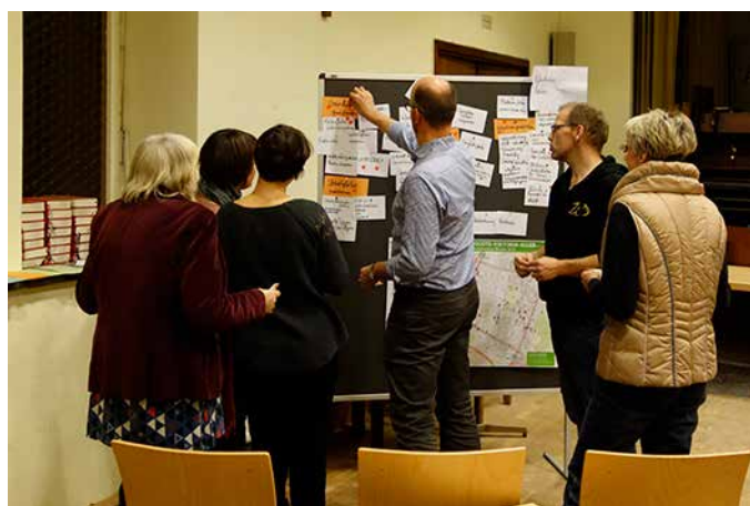
.. und legt die Schwerpunkte der Quartiersarbeit fest.

len, die das QM-Team zu konkreten Projektskizzen ausarbeiten und diese im Februar dem Gremium zur Abstimmung vorlegen wird. Zudem wird über die Verlängerung der Projekte abgestimmt, die aktuell auslaufen u.a. Lesefestival, Lichtergalerie, Gewerbenetzwerk, Ehrenamtsnetzwerk Schule – Kiez und Nachbarschaftsaktionen.