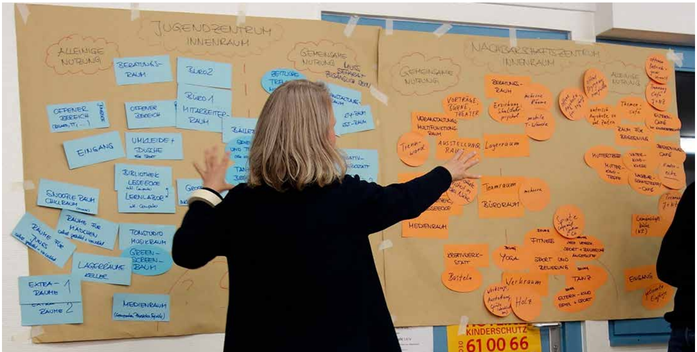
Ideensammlung auf dem Treffen im November 2018.

Bürgerversammlung am 31. Januar 2019 um 16.30 Uhr im Jugendcafé Laiv