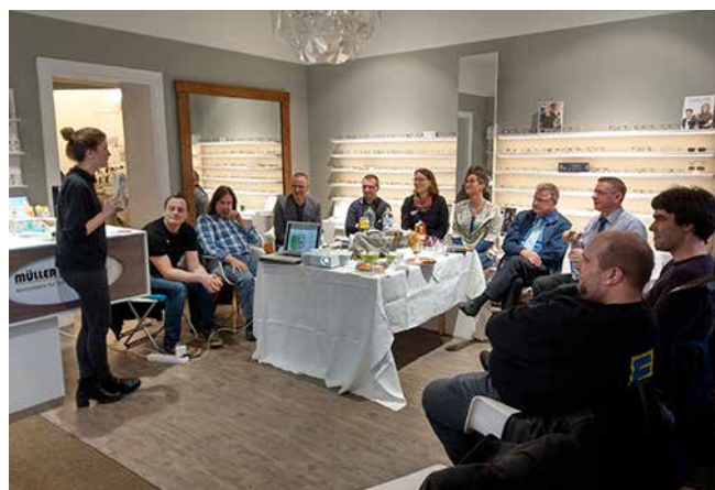
Abstimmungsrunde zur Kiezwerebekarte bei „Müller Optik“

Das fünfte Treffen des Gewerbenetzwerkes fand Ende März bei Müller Optik in der Scharnweberstraße 53 statt. Bei frisch gebackenen Brezeln und leckerem Aufstrich tauschten sich die Mitglieder des Gewerbenetzwerkes darüber aus, welche Illustrator/-in die geplante Kiezwerebekarte gestalten wird.