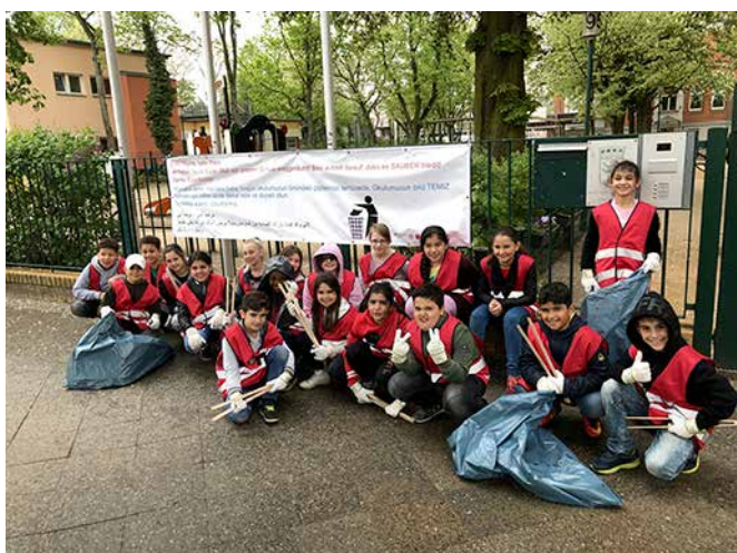
Erstaunt darüber, wieviel kleinteiliger Müll vor der Schule lag: Viertklässler/-innen der Mark-Twain-Schule.

Im Rahmen des Projektes Sauberkeit, Ordnung und Sicherheit wurde gemeinsam mit der Mark-Twain-Grundschule ein Aktionstag kreiert. Der öffentliche Bereich vor der Schule, wo insbesondere die Eltern am Nachmittag auf Ihre Sprösslinge warten, sollte gereinigt werden. Nachdem Schüler/-innen der vierten Jahrgangsstufe ihre Westen übergezogen hatten, wurden sie mit Handschuhen und Zangen, die dankenswerterweise von der BSR bereitgestellt wurden, ausgestattet. Gemeinsam wurden der Gehweg, der Fahrradweg und auch der Grünstreifen nach Müll durchkämmt. Nicht nur die begleitenden Erzieher waren erstaunt, wieviel „kleinteiliger“ Müll eingesam-